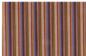
三河木綿 雅間道 (みやびかんどう)