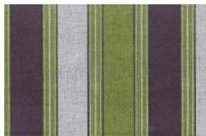
三河木綿 三色縞 (さんしょくじま)